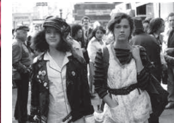
タイムズ・スクエア Studiocanal/Tamasa Distribution

精神病棟で偶然出会った二人の少女が病院を抜け出し、NYで二人だけの生活を始める。ラジオ番組DJがこの事態に注目し番組で取り上げたことで、次第に街中を巻き込む騒動となっていく。音楽に生きる少女を主人公に、自分勝手な大人たちへの反抗を描くティーンムービー。ロキシー・ミュージックなど1970年代のバンドの音楽に彩られた音楽映画としても楽しめる。のちに『エンパイア・レコード』(1995)を監督するアラン・モイルの長篇第2作。