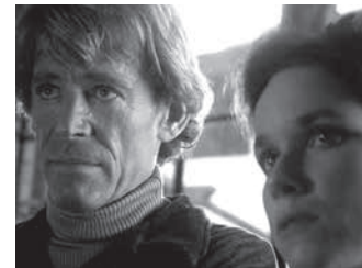
スタントマン Mercury Films

警察に追われる身のカメラマンは、戦争映画の撮影現場に遭遇。監督イーライの目に留まり、スタントマンとして雇われる。映画作りのためには犠牲を厭わないイーライの過激な演出に応え、カメラマンはスタントマンとして成長していくが……。ピーター・オートール演じる監督の狂気、弾薬をふんだんに使った激しいアクション、幾度も繰り返される印象的な音楽など、一貫して異様なテンションが支配する怪作にして、『フリービーとビーン大乱戦』(1974)などでも知られるリチャード・ラッシュ監督の代表作。