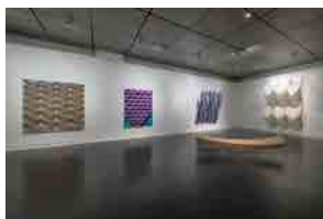
「小林正和とその時代」展 会場風景