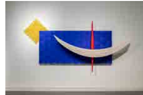
小林正和《SOUND COLLAGE-93》 1993年 京都市美術館蔵