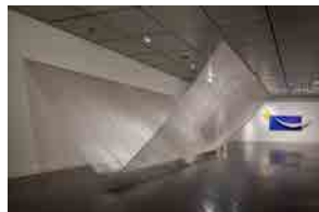
小林正和《MIZUOTO-99》 1999年頃 個人蔵