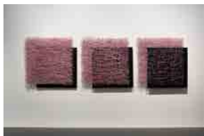
小林正和《HANAOTO-P3'91》 1991年 群馬県立近代美術館蔵