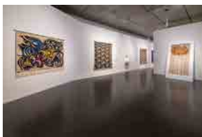
「小林正和とその時代」展 会場風景