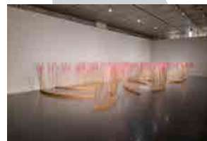
小林正和《KAZAOTO-87》 1987年 国立国際美術館蔵