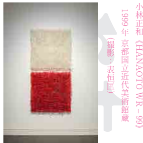
小林正和《HANAOTO WR-99》 1999年 京都国立近代美術館蔵