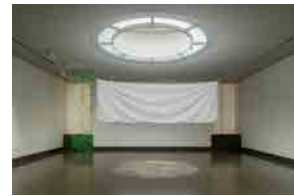
「小林正和とその時代」展 会場風景