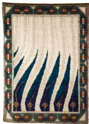
アクセリ・ガッレン＝カッレラ《炎》 1899年（デザイン）／1983年（再制作）

私たちが「フィンランド・デザイン」と聞いて思い浮かべるガラスや陶芸と同様に、1950年代には、リュイユはミラノ・トリエンナーレなどに出品され、受賞を重ねています。エヴァ・ブリュンメルや、ウフラ＝ベアタ・シンベリ＝アールストロム、リトヴァ・プオティラなど、リュイユが「フィンランド・デザイン」として国際的に高い評価を得た時期に活躍したデザイナーたちの代表作をご紹介します。