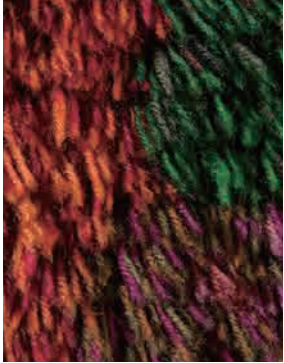
ウフラ＝ペクタ・シンベリ＝アールストロム 《採れたての作物》(部分) 1972年