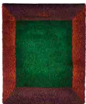
ウフラ＝ベアタ・シンベリ＝アールストロム 《採れたての作物》1972年

「やわらかな色面」を感じさせるリュイユの一番の魅力は、複雑に構成された色彩の表現にあります。ウフラ＝ベアタ・シンベリ＝アールストロム（1914-1979）は、水彩によるデザイン画をもとに、幾何学的な模様を無数の階調で表現した、リュイユの代表的なデザイナーの一人です。こうした色彩構成は、レーナ＝カイサ・ハルメ（b. 1940）の近年の作品のように、ウールのみならず、リネンやヴィスコースなどの異なる質感の素材を用いることで、より複雑な表現へと展開しています。