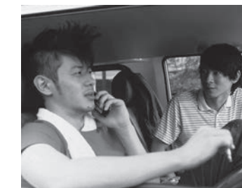
SCRAP HEAVEN ©2005『スクラップ・ヘヴン』パートナーズ

日本映画学校(現・日本映画大学)卒業制作で一 躍注目され、第12回PFFスカラシップ作品 『BORDER LINE』(02)で劇場映画監督デ ビューを果たした李相日。本作まで十代の若 者を描いてきた李が、同世代の加瀬亮とオダ ギリジョーを起用し、自身や社会の現状を打 破しようと暴走する30代前後の男2人を描 いたパディムムービー。単調な生活を変えた がっている警官が、意気投合した青年と「復 讐代行業」を開始する…。