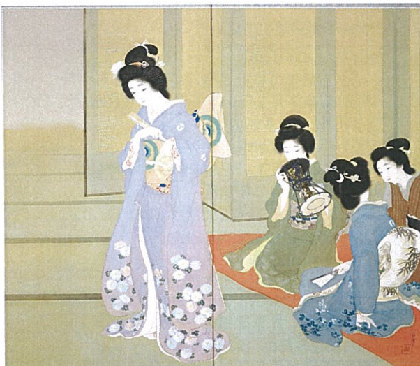
上村松園《舞仕度》1914年、京都国立近代美術館蔵

また、今後この4館のいずれかで企画される海外美術展鑑賞ツアー等は、どの館の友の会会員の皆様もご参加いただけるようになります。