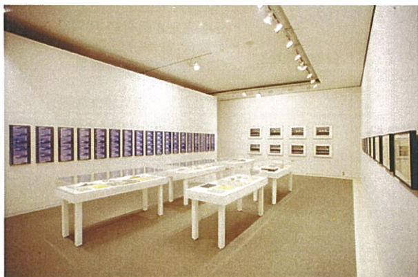
野村 仁《「HEARING」についての特別資料室》1970-76年(部分) ミクストメディア(音声による記録、資料、写真)／インスタレーション 京都国立近代美術館蔵