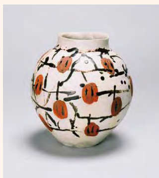
石黒宗麿《壺「晩秋」》1955年頃