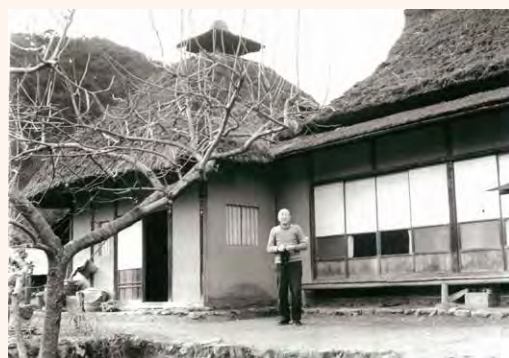
〈八瀬陶窯の柿の木と石黒宗麿〉1956年頃