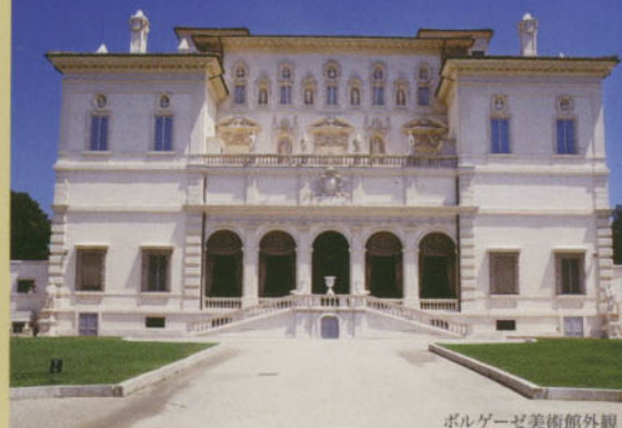
ボルゲーゼ美術館外観

このたび、「日本におけるイタリア2009」を記念し、ボルゲーゼ美術館のコレクションを日本でまとめてご紹介する初めての機会となりました。15世紀から17世紀にかけて花開いたイタリア美術の流れを、ラファエロの《一角獣を抱く貴婦人》をハイライトに、カラヴァッジョという「異端児」が登場する終盤まで、選りすぐられた約50点の珠玉の名品によってご堪能ください。