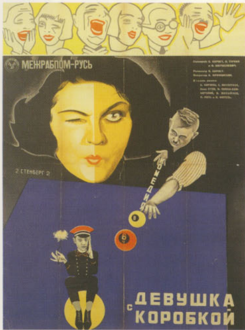
ステンベルク兄弟「帽子箱を持った少女」 (1927年、ボリス・バルネット監督)