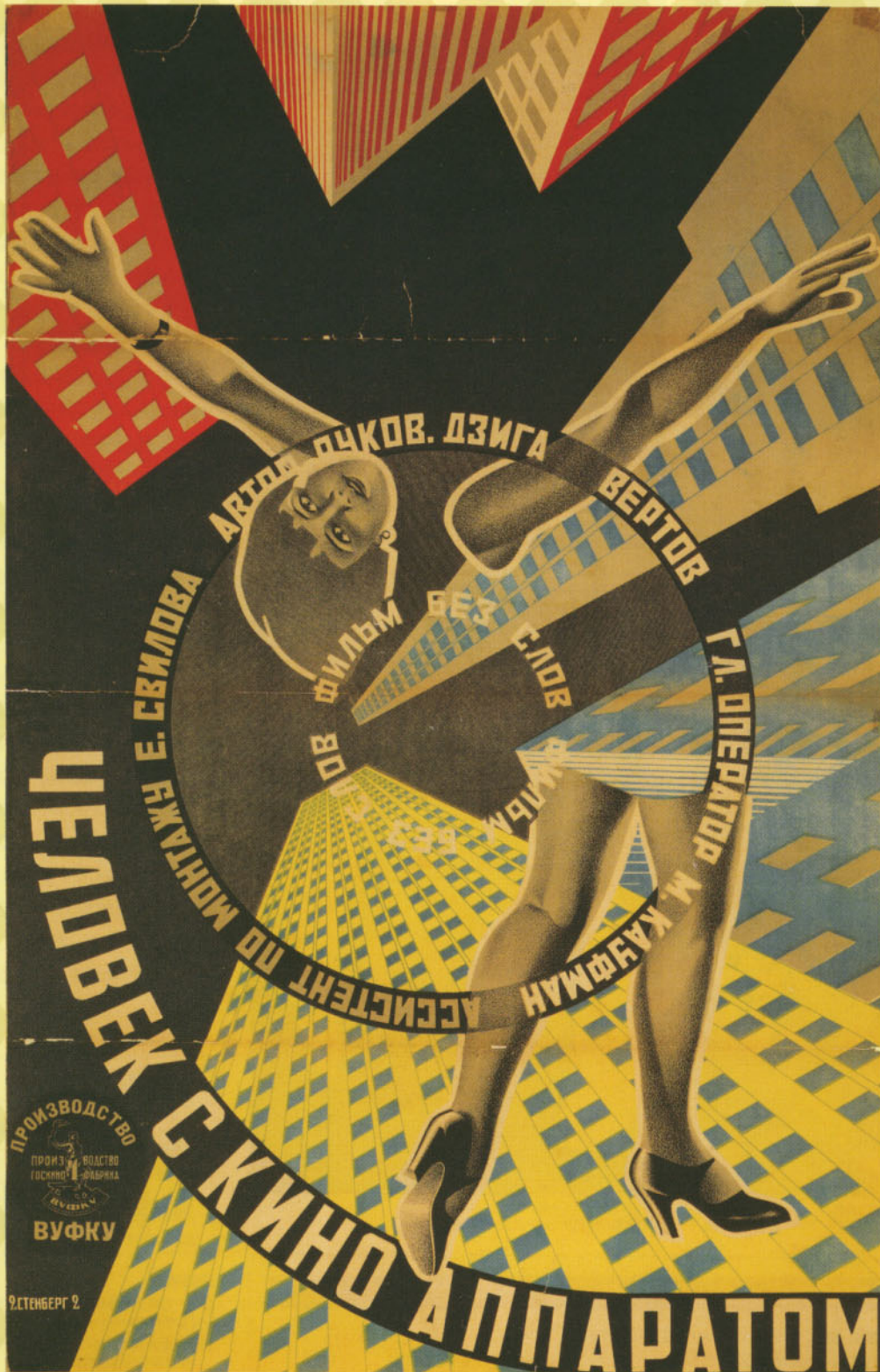
ステンベルク兄弟《カメラを持った男》 (1929年、ジガ・ヴェルトフ監督)