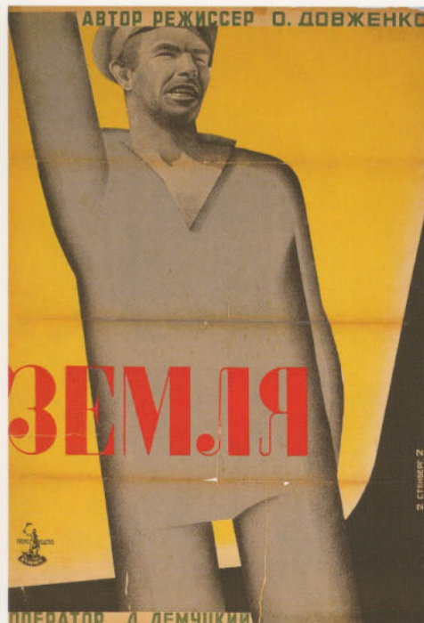
ステンベルク兄弟「大地」 (1930年、アレクサンドル・ドヴジェンコ監督)

1917年のロシア革命によって成立したソビエト連邦では、新しい社会体制を背景に、様々な革新的芸術表現の試みがなされました。中でも、映画という新世代の表現形式を大胆に改革し、エイゼンシュテイン、ブドフキン、ドヴジェンコ、ヴェルトフをはじめとする先鋭的な映画芸術家を輩出して世界に衝撃を与えたことは、よく知られています。同じ時期、グラフィック・アートの分野でも若手芸術家が活動を開始し、とりわけ1920年代に盛んになった構成主義の思潮は、新たな社会の建設を目指す国家の志向と相まって、大きな影響力を持ちました。本展でとりあげる「映画ポスター」は、ソビエトの前衛芸術運動推進の機動力となったこれら2つの分野の結節点ともいえる媒体であり、ステンベルク兄弟を筆頭に多くの優れたポスター・デザイナーの活躍の場となりました。