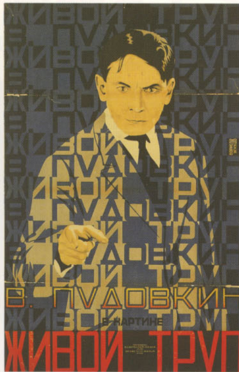
グリゴリー・ボリノフ / ビョートル・ジュコフ「生ける屍」 (1929年、フョードル・オツェプ監督)