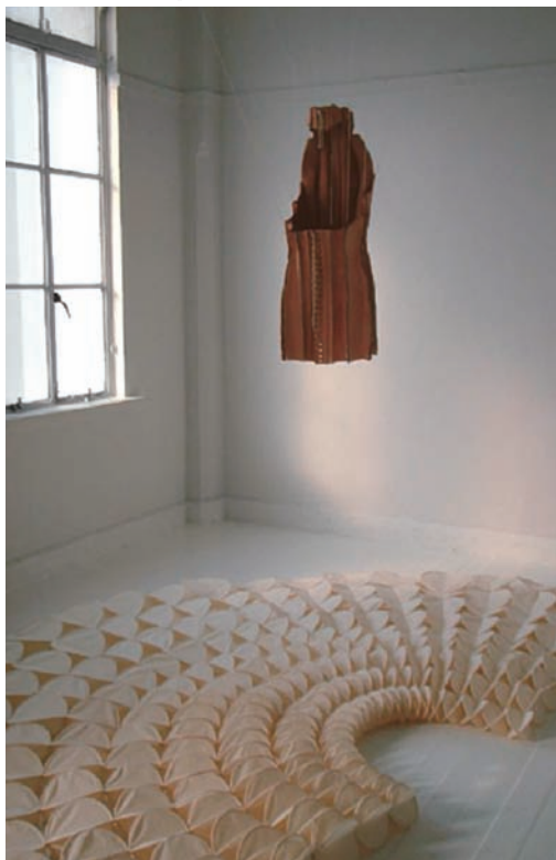
CE00[costume], 2003/ Collaborator: Makoto SAHARA