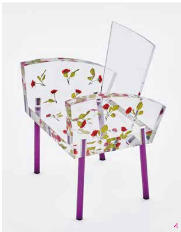
1.《変型の家具 Side 1》1970年 青島商店エムプラス蔵 2.ランプ(オバQ)[小] 1972年 個人蔵 3.《ハウ・ハイ・ザ・ムーン》1986年 富山県美術館蔵 4.《ミス・ブランチ》1988年 石橋財団アーティゾン美術館蔵 表面=《硝子の椅子》1976年 京都国立近代美術館蔵