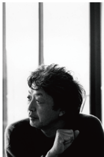
倉俣史朗 1990年

In 1965, Kuramata Shiro (1934–1991) established the Kuramata Design Office, and in addition to making interior designs, primarily for shops, he created furniture on an independent basis. In the 1980s, he took part in Memphis, a movement launched by an Italian design group, and expanded his practice internationally. As indicated by key works like Glass Chair and Miss Blanche , Kuramata developed richly poetic pieces using materials such as acrylic, glass, and steel mesh, which had previously never been used in interior design or furniture. In this exhibition, we present a career-spanning overview of Kuramata Shiro's works, including design drawings, sketches, and entries from his dream Journal, alongside the artist's own words.