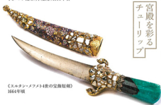
《スルタン・メフメド4世の宝飾短剣》 1664年頃