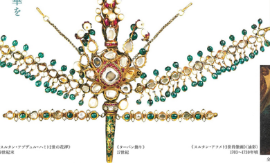
《ターバン飾り》 17世紀