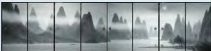
《桂林月宵》昭和55（1980）年 唐招提寺