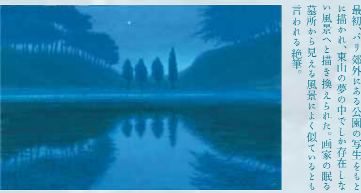
《夕暮》平成11（1999）年 長野県信濃美術館 東山魁夷館

最初、パリ郊外にある公園の写生をもとに描かれ、東山の夢の中でしか存在しない風景へと描き換えられた。画家の眠る墓所から見える風景によく似ているとも言われる絶筆。