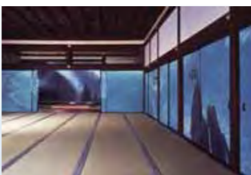
唐招提寺 御影堂 宸殿の間から上段の間をのぞむ

東山にのぼる満月に照らされた、円山公園の名高い枝垂桜を描いている。 京都は画家にとって、神戸時代以来 たびたび訪れた懐かしい町であると共に、作家の川端康成より、 急速に失われつつあるかつての姿を 画面に描き止めるよう勧められていた町でもあった。