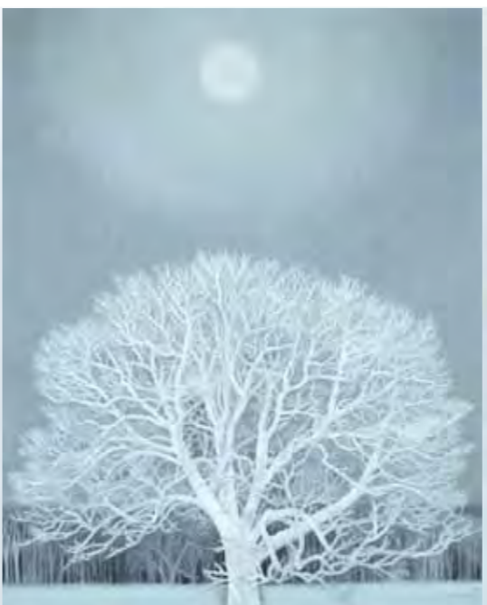
《夕暮》昭和39（1964）年 東京国立近代美術館

昭和37（1962）年の北欧旅行で取材した風景に 想を得て描いた、幻想的な作品。 北欧は以前写真真集で見ただけの、 初めて訪れた土地であったが、かねてより北方の風景や 精神性に惹かれていた東山の焦点にびたりと適合した。