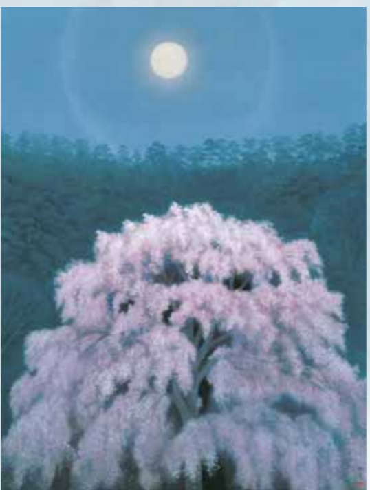
《花明り》昭和43（1968）年 株式会社大和証券グループ本社

昭和37（1962）年の北欧旅行で取材した風景に 想を得て描いた、幻想的な作品。 北欧は以前写真真集で見ただけの、 初めて訪れた土地であったが、かねてより北方の風景や 精神性に惹かれていた東山の焦点にびたりと適合した。