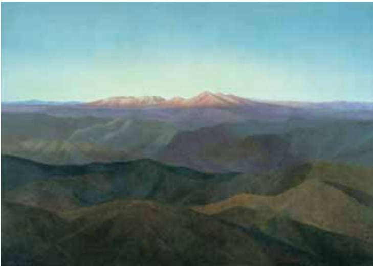
《残照》昭和22（1947）年 東京国立近代美術館

終戦直後妻以外の家族と家を失った東山が、 気負うことなく素直な目と心で 自然を見つめて描いた。 結果、官展で初めて特選を受け、 後に「国民的風景画家」と呼ばれるようになる画家の 第一歩を印した記念的作品。