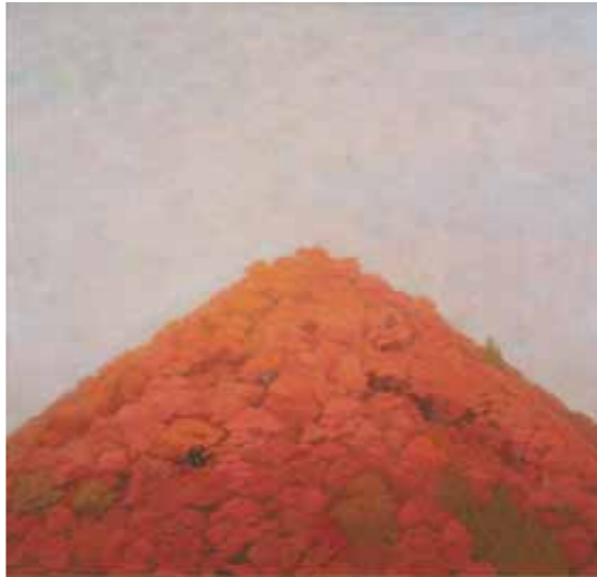
《秋鷲》昭和33（1958）年 東京国立近代美術館

冬を目前にした「薄曇りの午後、それも 盛りを過ぎようとする紅葉の山のたたずまい」 （作者の言葉）「萌春」61号昭和33年11月）に、間もなく 落葉する自らの運命を受け入れ、 静かに終わりを待つ姿を感じ、心うたれて描いた作品。