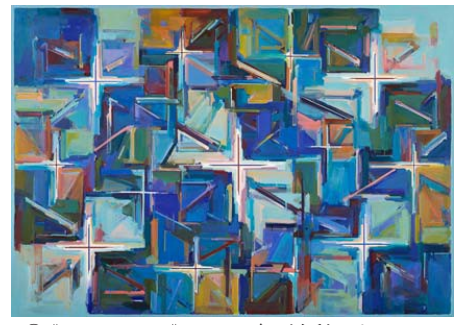
③《Work F.116》1992年 油彩・キャンバス