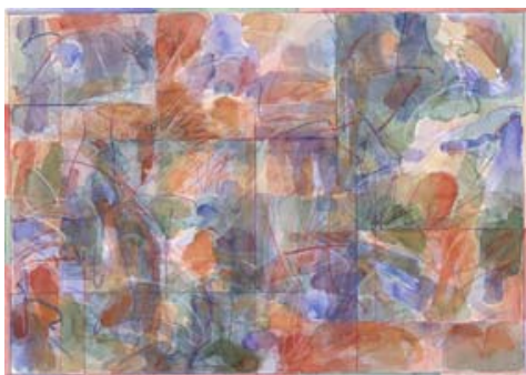
⑩《Work Ep.447》1984年 水彩・紙