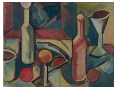
⑥《Still Life no.64》1953年 油彩・キャンバス