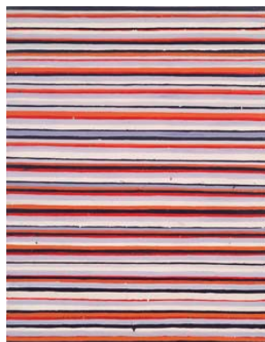
⑧《Work C.92》1961-62年 油彩・キャンバス 横浜美 術館蔵