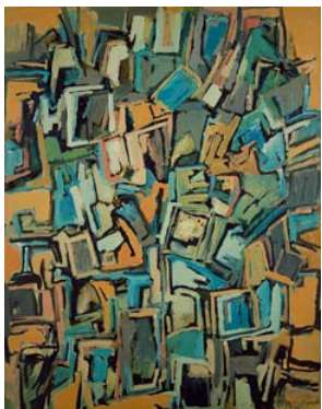
⑦《Work B.125》1956年 油彩・キャンバス 宇 都宮美術館蔵