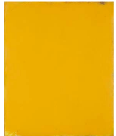
⑨《Color no.98》1999-年 油彩・キャンバス