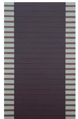
⑫《Work C.216》1964-65年 油彩・キャンバス