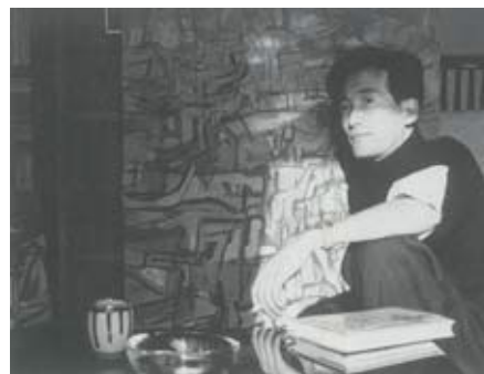
⑪ 山田正亮ポートレート 1956 年